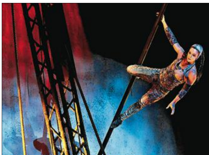
EDDERKOPP: En menneskelig edderkopp på en pendlende stang.